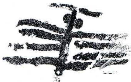
Figura oculada de la Penya de Sant Esperit.

Te-bo o Ti-bo segons les diverses propostes d'abecedaris ibers). Si els símbols del gravat implicaren un missatge escrit, caldria veure si el traç que tanca el triangle és una T ibera. Amb tot, ens trobaríem davant d'una mena de gliptograma amb tres signes gràfics que es disposen de forma que la seua combinació i lectura podrien expressar un missatge hui desconegut.