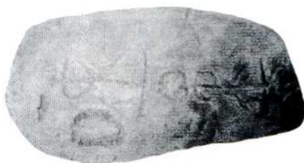
Figura de la Penya de l'Albarda.

Amb l'objectiu de contextualitzar la troballa, caldria reparar en primer lloc en l'ídol oculat pintat a les Penyes de Sant Esperit 24 , en què apreciem un eix vertical amb cinc traços horitzontals. Unes altres referències properes les trobem en la creu de dos braços de les Coves del Sargal a Viver 25 i també en la denominada Peña de la Albarda del Barranco Cardoso a la localitat d'Almohaja, província de Teròl 26 . La creu, com a símbol primitiu ens remet a l'arbre, a la fertilitat de la terra, i el cristianisme l'adoptà a partir del segle IV com a signe d'identificació i redempció. En aquest sentit hem de