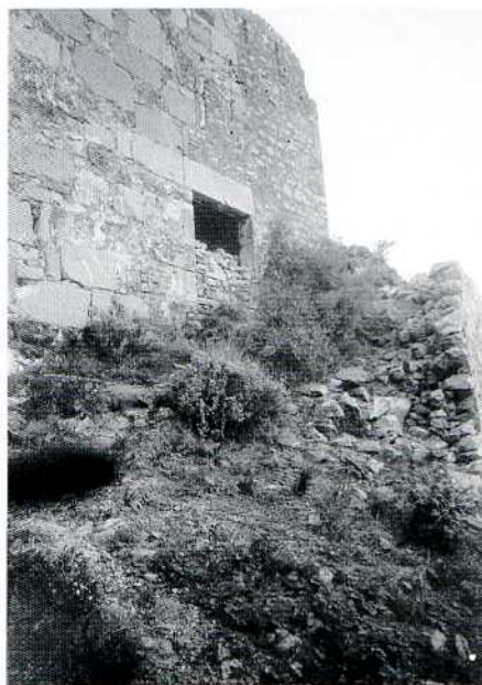
Porta nord de la plaça del Refectori vista des de la porta de Mahoma.

El gravat es troba a la penúltima pedra superior del brancatge dret de la porta falsa del Refectori, sentit sud-nord. Sembla ser un prisma de 80 per 70 i per 33 cm, si bé com s'aprecia en la fotografia els angles interiors estan retallats cap a dins. La cara major s'alinea en el mur i mostra un forat rectangular de 10 per 4 cm que podríem interpretar com el mos on fixar les tisorres per elevar la pedra, de no ser com veurem per l'exagerada fondària, uns 10 cm. La cara del prisma petri que conforma el buit de la porta, que fa 80 per 33 cm, és el lloc on es féu el gravat que ens ocupa. Consta de quatre elements: el cercle gran, la figura central, el cerclet partit i l'asterisc, gravats els tres primers possiblement amb punxó i el quart, donat la seua perfecció, amb cisell de tall recte i fi, de 4,5 cm.