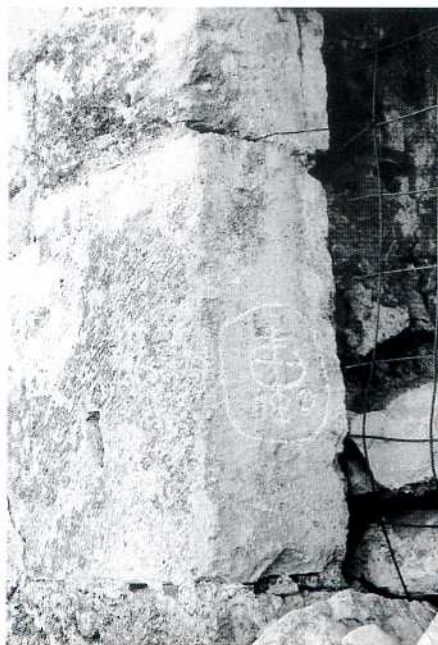
Carreu mostrant el gliptograma i el buit practicat en una de les cares.

La muralla on es troba la porta del gravat es va construir amb materials del fòrum romà com demostren claríssimament les lloses de calcària dolomítica amb forats que servien per enganxar les reixes que hi protegien les estàtues 5 . Això ens fa pensar que la pedra