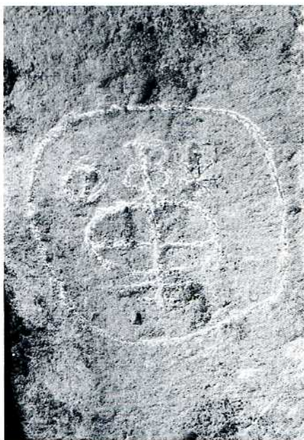
Primer plànol del gliptograma en la posició que proposem com original.

on es troba el gravat podria ser també del fòrum; ja que, com es pot comprovar encara, la pedra travertina s'emprà per fer dovelles, relleus i brancatges de porta. La constatació, per si mateixa, no evidencia que el gravat siga del primer segle de la nostra era en què es data la construcció del fòrum, perquè podria haver-se realitzat quan la pedra ja formava part de la porta actual. Ara bé, nosaltres considerem que el gravat es troba invertit. Deducció que fem en advertir que el forat de la cara exterior del carreu és massa fondo per a ser el segur on s'afermaven les tisores que elevaven les pedres i sembla més lògic