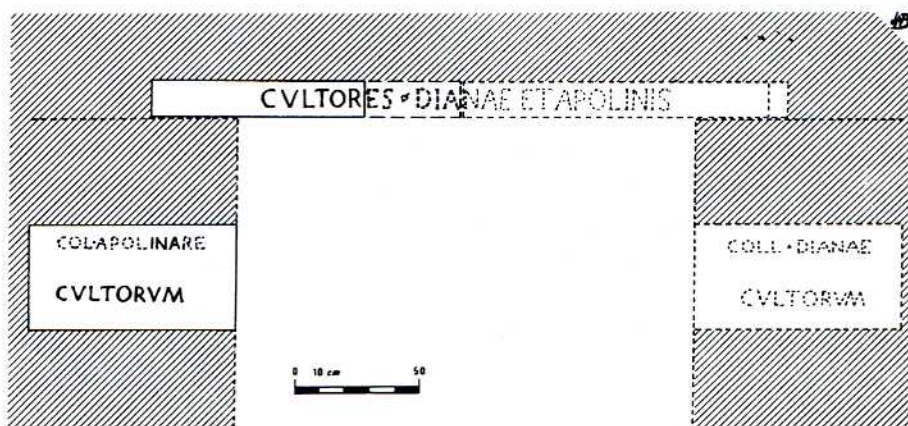
Restitució hipotètica de la porta de la seu dels cultors Dianae et Apol(l)inis de Sagunt segons J. N. Bonneville.

l'autor a l'angle nord-oest del fòrum 17 i açò ens acosta a la suposició que fèiem sobre la procedència de la pedra del gravat; ja que, si la pedra formava part del brancatge de la porta del temple, sembla lògic que en un moment de decadència un nadiu aferrat a la religió autòctona el realitzara.