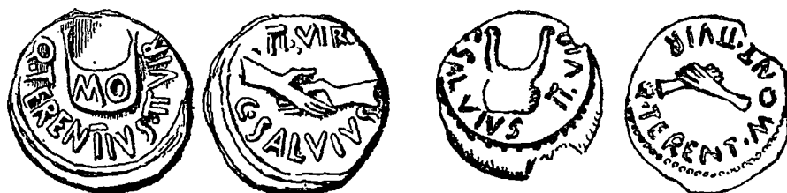
Semis atribuidos a Ilici (ACIP 2623-2624 = RPC I 187-188 = CNH Ilici 1-2)

utilizado para señalar que la colonia sería fundada ca. el año 43/42 a.C. 14 , fecha en que Lépido era gobernador de la provincia de la Hispania Citerior. Por tanto, de una manera directa o indirecta, sería el triunviro Lépido el responsable de la instalación de la colonia de Ilici 15 .