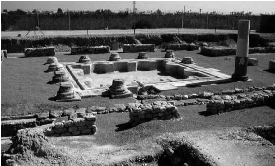
Restos de una domus de Ilici (wikipedia)

De hecho, para Allély, que la primera emisión de Ilici recuerde a la amonedación tardo-republicana es significativo de que la colonia debería ser de época triunviral, aunque no se decide por su autoría, es decir, si se trata de una obra de Lépido o de C. Julio Octaviano ( cos. I 43 a.C.), futuro Augusto. Sea como fuere, la misma investigadora considera que el creador de la fundación podría ser muy bien Lépido, al recoger el tipo de las manos entrelazadas la buena “entente” de inicios del Segundo Triunvirato 24 .