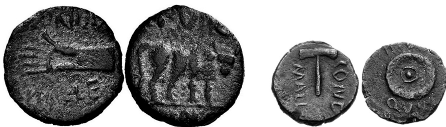
Semis y cuadrante de la serie Conduc.-Malleol. (RPC I 158-159)

De esta manera, pensamos que es muy factible que Lépido estableciese en Ilici una colonia de veteranos, aunque las circunstancias exactas se desconocen. No puede establecerse que fuese planificada por César o, cuanto menos, no existe dato alguno que apoye tal aseveración, puesto que no tenemos información sobre la postura de los habitantes de Ilici durante el conflicto armado que enfrentó en la Península a cesarianos y pompeyanos durante la guerra civil. Pudiera pensarse que, como en otros casos, como el más conocido de Urso (Osuna, prov. Sevilla), el apoyo prestado por la comunidad al bando pompeyano originase la lógica represalia por parte de los vencedores, que convertirían la población en una colonia. Pero, repetimos, no existe elementos que avalen esta suposición.