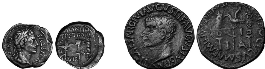
Semis y as de Ilici (ACIP 3201 = RPC I 190 y ACIP 3205 = RPC I 194 respectivamente)

Ilici A(ugusta) en las posteriores (ACIP 3203-3210 = RPC I 192-199), todas ellas acuñadas en época de los emperadores Augusto (27 a.C.-14 d.C.) y Tiberio (14-37 d.C.) 5 .