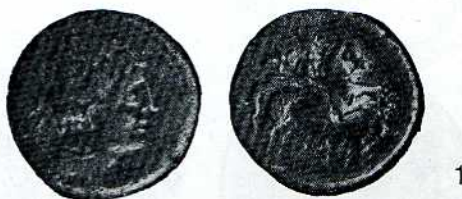
Fig. 1.—MONEDA IBERICA DE ARSE (Sagunto)

Prosiguiendo las noticias que habitualmente venimos publicando en este Boletín de los hallazgos numismáticos sobre nuestra ciudad, ofrecemos en el presente las siguientes: