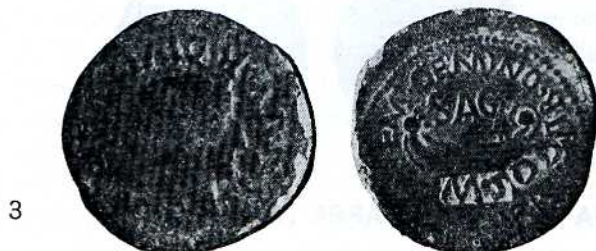
Fig. n.º 3.—EMPERADOR TIBERIO, (14-37).

En ninguna de las dos caras se le puede apreciar leyenda alguna por su mal estado de conservación.