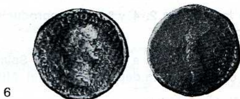
Fig. n.º 6.—EMPERADOR DOMICIANO, (81-96), hijo de Vespasiano.

Mediano bronce de oricalco, diámetro 0'027 m.