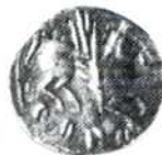
Làmina I. — Dracmes 1 i 2 a doble grandària, les 3 a 6 a escala natural