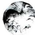
Làmina II. — Dracma 7 a doble de grandària, les 8 a 11 a escala natural